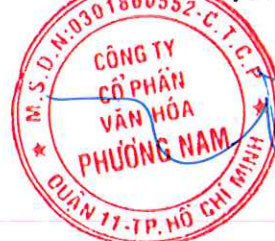
ĐẶNG BÁ TÙNG